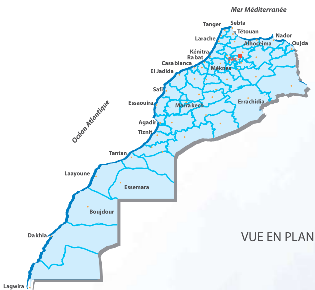
VUE EN PLAN